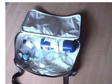
Fig. 2: 2 l oxygen flaske i taske.