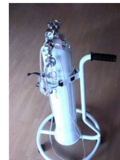
Fig. 1: 10 l oxygen flaske i stativ.

Brug ALDRIG Oxygen i naerheden af aaben ild da Oxygen naerer en forbraending.